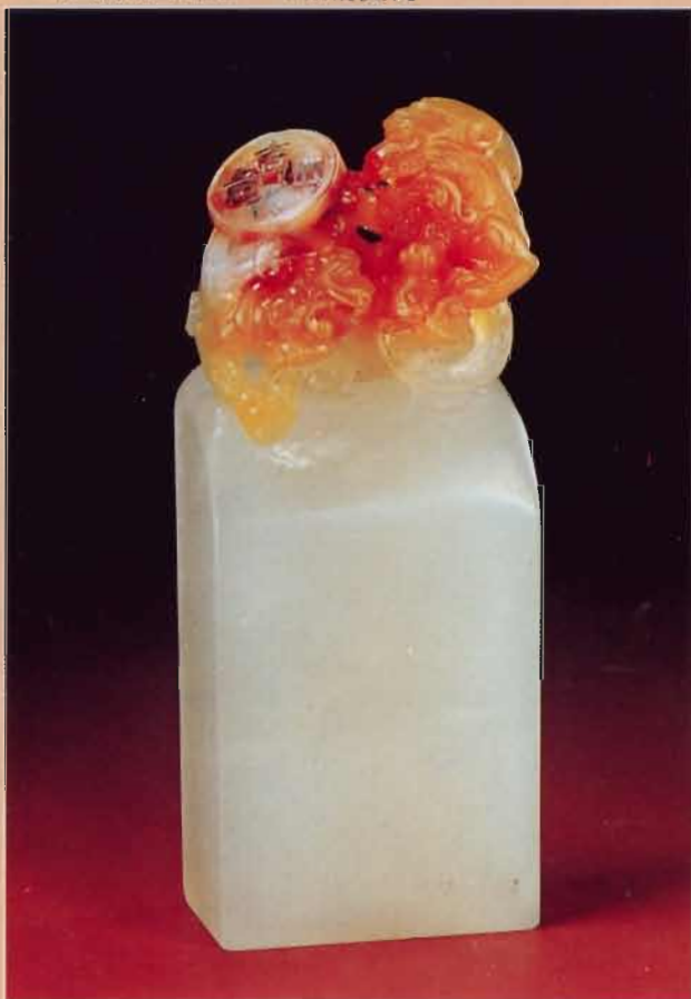
▼巧色荔凍的印石，可怡情養性。