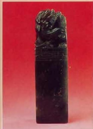
▲艾葉綠印石是稀世珍寶。